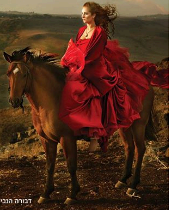
דבורה הנביאה, אם-תלכי עמי והקכתי; ואם-לא תלכי עמי, לא אקר, שופטים ד', ח'.

אותו, הבדים הארוכים הרכה פעמים מבהילים או מסקרנים אותו. מגש המזון כאביגיל נראה לאתון מאוד טעים והיא ניסתה לאכול ממנו לא פעם. הצילומים הללו הסתיימו עם הכי הרכה פציעות אומנם, אך גם תחושת ניצחון של ממש כשאני מצליחה להשיג את הפריים לו ייחלתי."